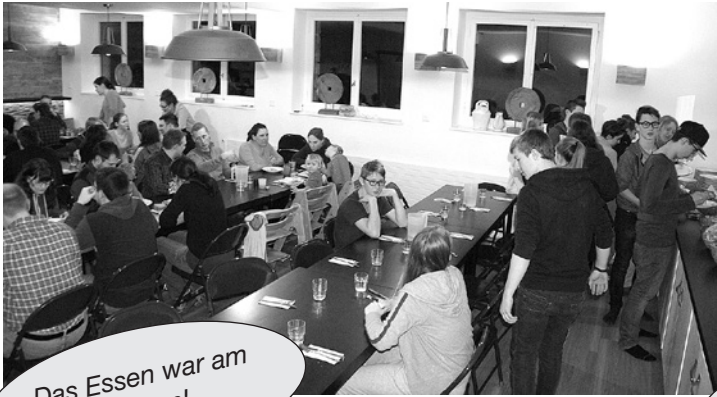
Das Essen war am besten!