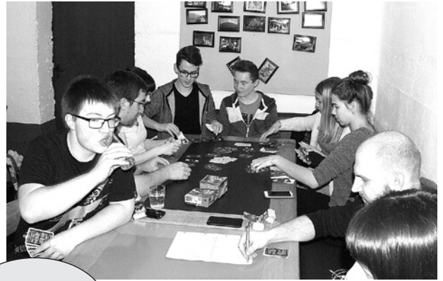
Es war SUPER!