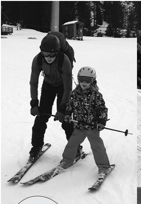
Es war super, das Haus toll, die Pisten gut.