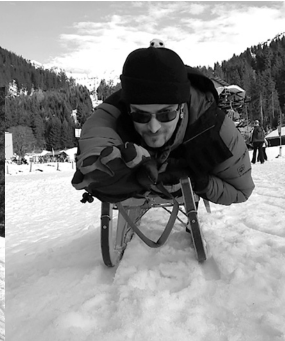
Am Samstag genossen wir einen herrlichen Skitag bei wunderschönem Wetter. Gott war spürbar bei uns.