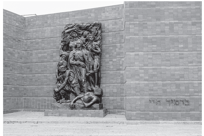
Holocaust Gedenkstätte Yad Vashem