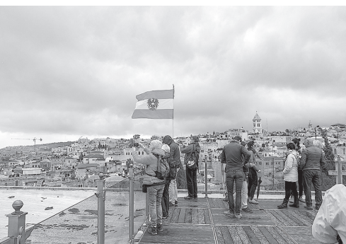
Blick vom österreichischen Hospiz