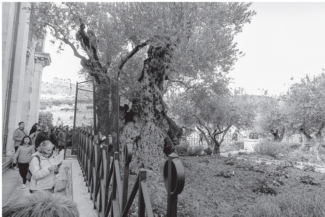
Olivendbaum mit 2000-jährigem Wurzelstock