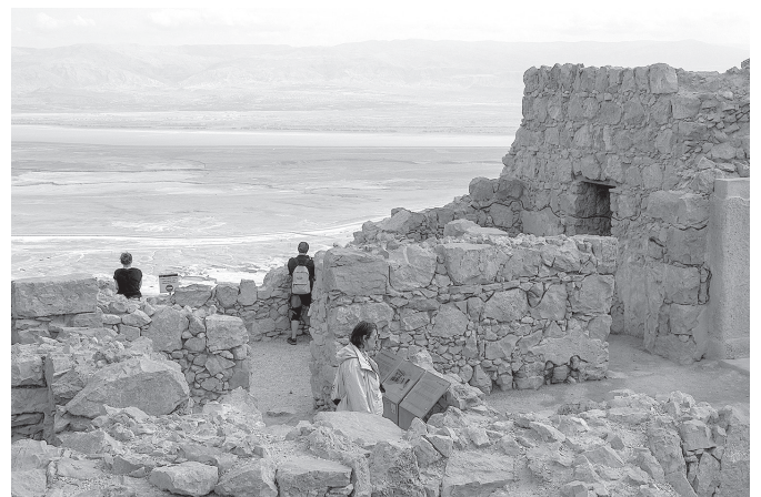
Blick von den Ruinen der Festung Massada auf das Tote Meer