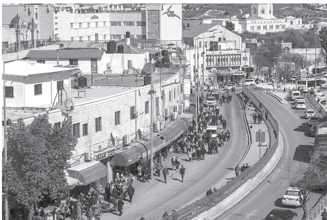
Blick von der Altstadtmauer auf das moderne Jerusalem