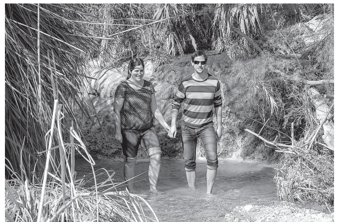
Erfrischung im Naturpark En Gedi