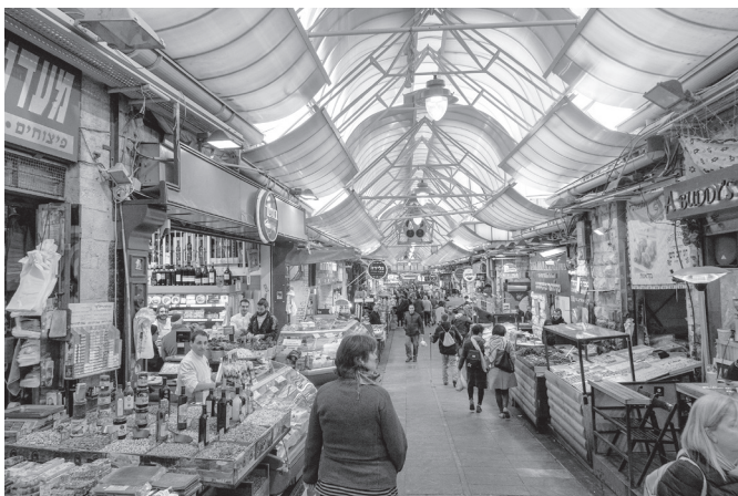
Eingang zum jüdischen Markt