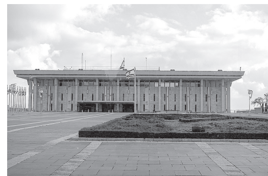
Die Knesset - das israelische Parlament