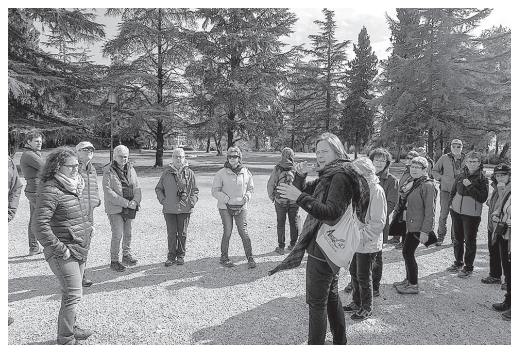
Auf dem Herzberg