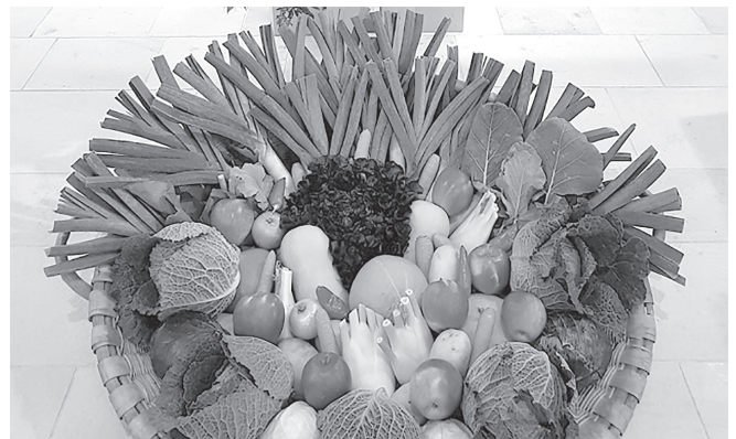
Erntedankkorb von einem Bauernhof aus unserer Gegend.

Nun, die reiche einheimische Ernte auch der Kartoffeln ist ein grosser Segen. Nehmen wir sie dankbar entgegen.